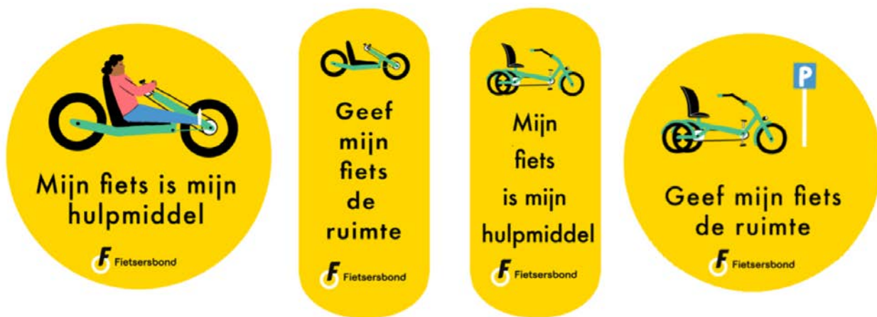
Figuur 1. Stickers voor aangepaste fietsen - ontwikkeld en uitgegeven door de Fietzersbond

Landelijke uniformiteit voorkomt onduidelijkheid voor gebruikers die zich tussen gemeenten verplaatsen en versterkt de handhaafbaarheid.