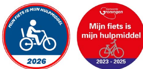
Figuur 2. Twee voorbeeldontwerpen van een ontheffingssticker voor hulphietsen met jaaraanduiding

Voor mensen met een duidelijk herkenbare hulphiets, zoals een driewieler of rolstoelfiets, kan in de praktijk soms worden volstaan zonder sticker, omdat deze fietsen door hun uiterlijk al herkenbaar zijn. Toch wordt ook deze groep geadviseerd de herkenbare sticker aan te vragen, zodat er geen twijfel kan ontstaan over hun recht op gebruik van speciale voorzieningen en ontheffingen.