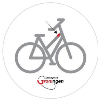
Figuur 4.2: Plaatsingsinstructie sticker fietsontheffing (gemeente Groningen)

Om te borgen dat de ontheffingsaanduiding overal op dezelfde wijze wordt aangebracht, is onze aanbeveling om bij de uitgifte standaard een plaatsingsinstructie mee te geven, zoals in het voorbeeld van gemeente Groningen in figuur 4.3. Hiermee wordt uniformiteit in herkenbaarheid voor handhavers en andere weggebruikers ondersteund.