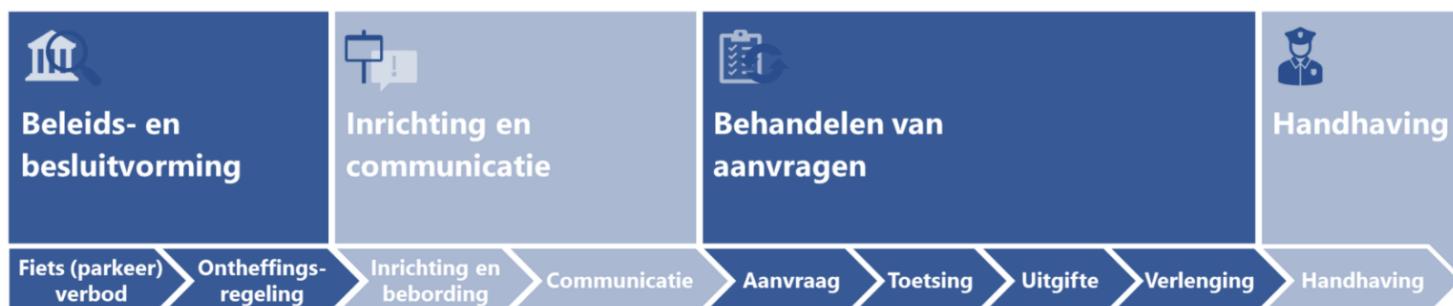
Figuur 4.1: Bepalende stappen voor het functioneren van fietsontheffingen in de praktijk

Het proces om te komen tot fietsontheffingen hebben we onderverdeeld in stappen, zoals hieronder opgenomen in figuur 4.1. In dit hoofdstuk geven we per processtap onze aanbeveling voor een standaard aanpak ofwel voor nadere uitwerking. Sommige van deze stappen komen uitgebreid aan bod in eerdere publicaties over fietsparkeren 10 en voetgangersgebieden 11 die in opdracht van CROW/KpVV en Tour de Force zijn opgesteld. Deze publicaties zijn te raadplegen via de online kennisbanken van CROW Fietsberaad en Tour de Force.